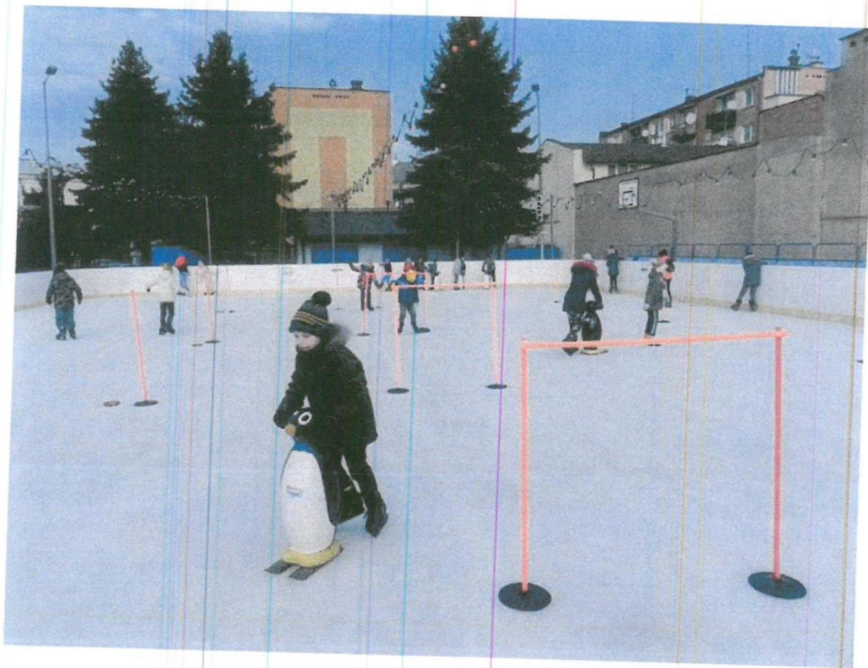
Tabela wstępów za rok 2022 z programu „Jarosławska Karta Dużej Rodziny”

16 lutego w ramach akcji „Ferie na sportowo” zorganizowane zostały gry i zabawy dla dzieci i młodzieży.