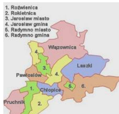
Rysunek 2. Gminy sąsiadujące

Powierzchnia miasta wynosi 34,46 km 2 , co stanowi 3,4% powierzchni powiatu i 0,2% powierzchni województwa. 72% powierzchni gminy stanowią użytki rolne. Biorąc to pod uwagę dość wysokie - na tle województwa - zaludnienie miasta, należy przyjąć, że centrum miasta jest obszarem silnie zurbanizowanym.