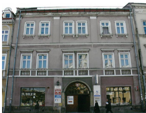
Fot. 5. Kamienica Gruszewiczów