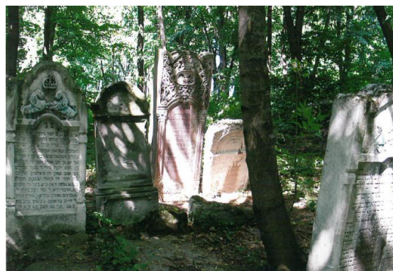
Fot. 7. Cmentarz Żydowski