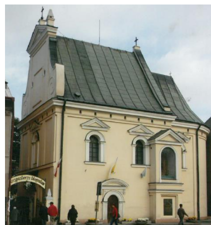
13. Kościół św. Ducha (za: GEZ)