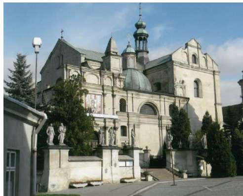
8. Kolegiata Bożego Ciała (za: GEZ)