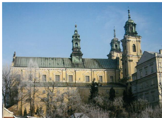
12. Bazylika Matki Bożej Bolesnej