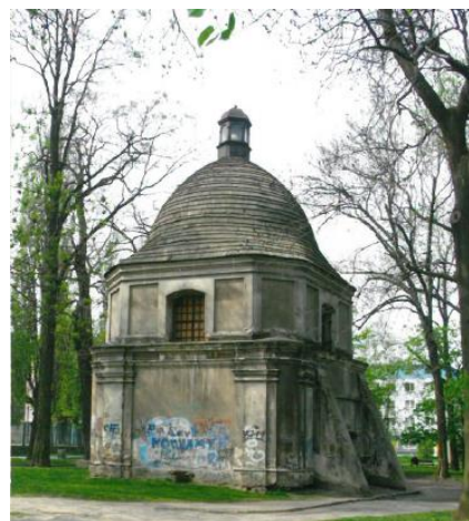
Fot. 3. Cerkiew Zaśnięcia Najświętszej Maryi Panny