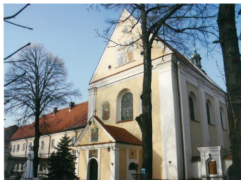
9. Kościół Trójcy Przenajświętszej (za: GEZ)