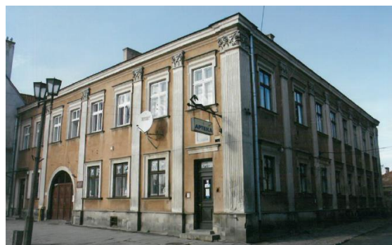
11. Kamienica Królowej Marysieńki