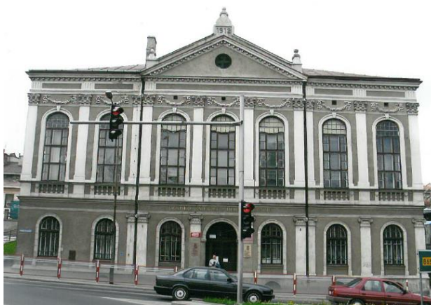
Fot. 2. Budynek Stowarzyszenia w Jarosławiu