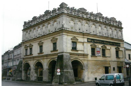
Fot. 4. Kamienica Oresttich