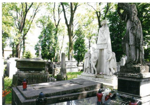
Fot. 6. Stary Cmentarz