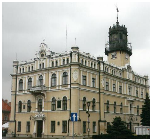
Fot. 1. Ratusz w Jarosławiu