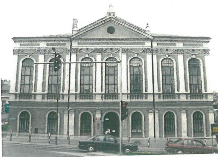
Fot. 2. Budynek Stowarzyszenia w Jarosławiu

Wpis do rejestru zabytków: A-707 z 16.01.1984