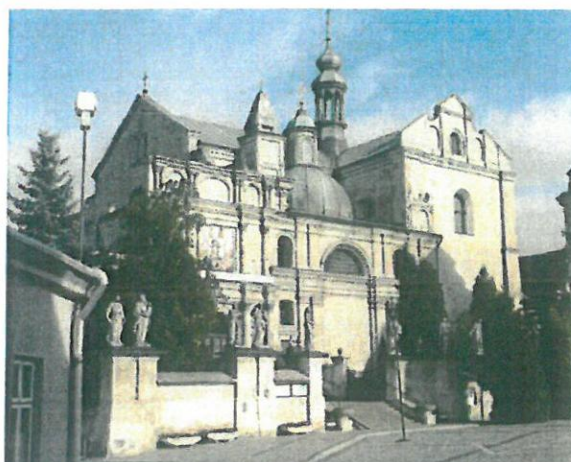
8. Kolegiata Bożego Ciała