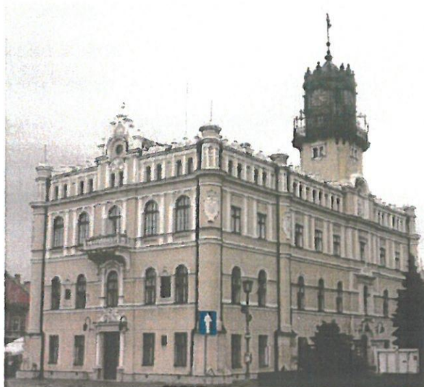
Fot. 1. Ratusz w Jarosławiu