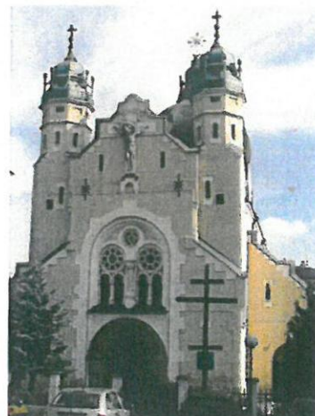
10. Cerkiew Przemienienia Pańskiego