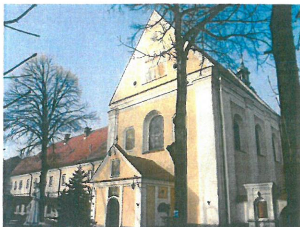
9. Kościół Trójcy Przenajświętszej (za: GEZ)