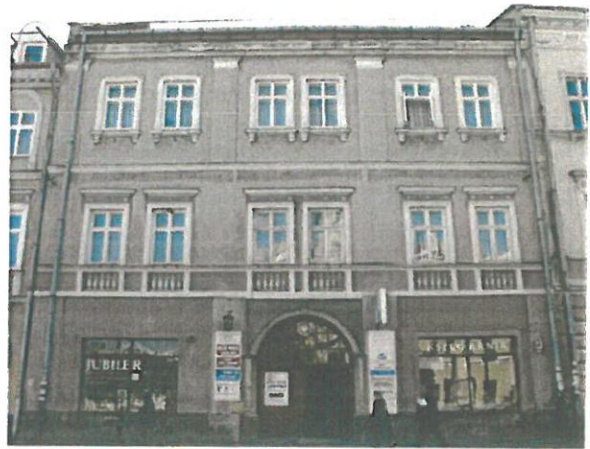
Fot. 5. Kamienica Gruszewiczów