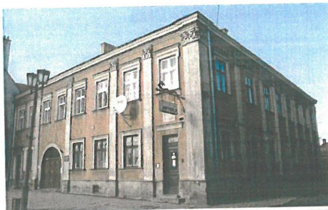
11. Kamienica Królowej Marysieńki