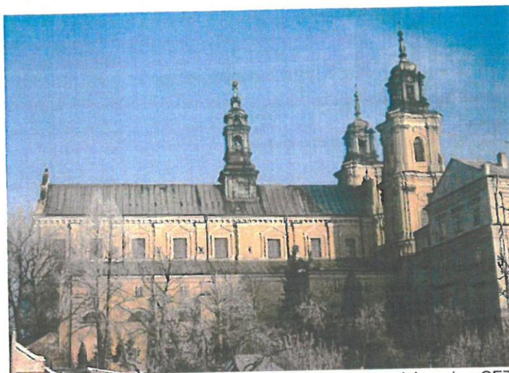
12. Bazylika mniejsza