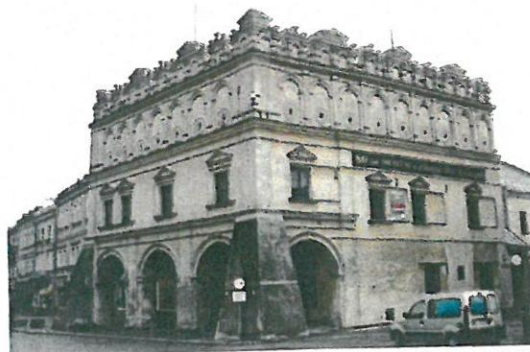
Fot. 4. Kamienica Orsettich

Wpis do rejestru zabytków: A-46 z 28.02.1951