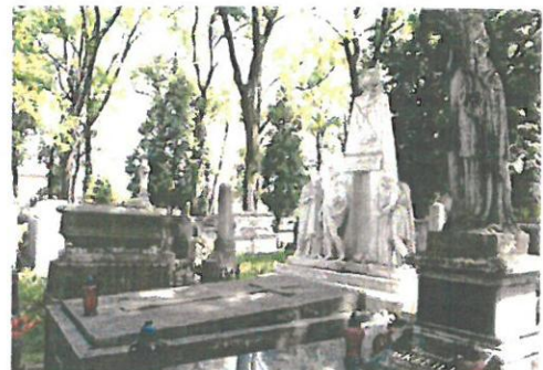
Fot. 6. Stary Cmentarz