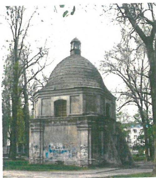
Fot. 3. Cerkiew Zaśnięcia Najświętszej Maryi Panny

Wpis do rejestru zabytków: A-12/45 z 22.02.1951