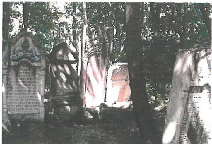
Fot. 7. Cmentarz Żydowski