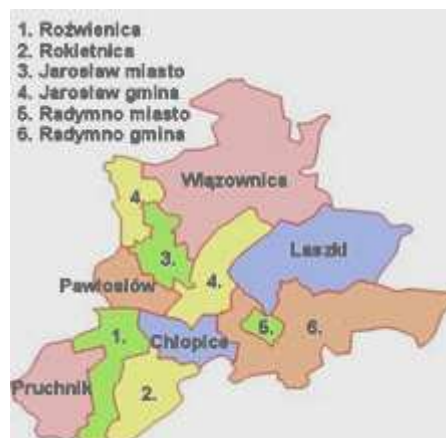
Rysunek 2: Gminy sąsiadujące

Powierzchnia miasta wynosi 34,46 km 2 , co stanowi 3,4% powierzchni powiatu i 0,2% powierzchni województwa. 72% powierzchni gminy stanowią użytki rolne. Biorąc to pod uwagę oraz dość wysokie - na tle województwa - zaludnienie miasta, należy przyjąć, że centrum miasta jest obszarem silnie zurbanizowanym.